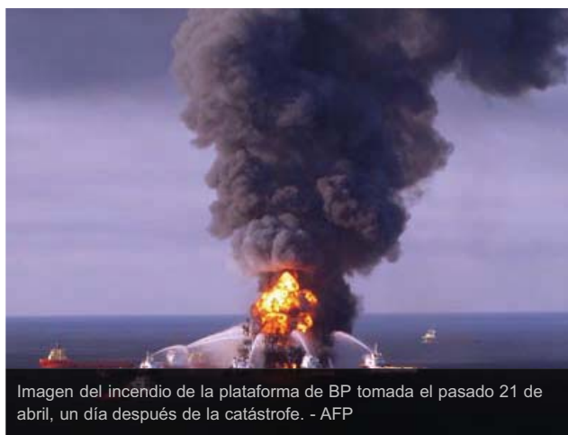
Imagen del incendio de la plataforma de BP tomada el pasado 21 de abril, un día después de la catástrofe.